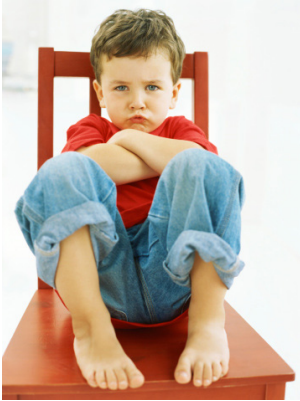
Illustration de garçon debout : « À l'intérieur je suis toujours debout !j »

En versets 18-19 Que personne, sous prétexte d'humilité et d'un culte des anges, ne vous conteste à son gré (le prix de la course) ; (un tel homme) s'abandonne à des visions, il est enflé d'un vain orgueil par ses pensées charnelles, au lieu de s'attacher au chef par qui tout le corps soutenu et rendu cohérent par les jointures et les articulations, grandit d'une croissance qui vient de Dieu.